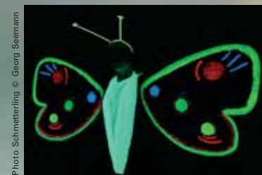
Photo Schmettlerling

Bitte etwas zu Essen und Trinken mitbringen.